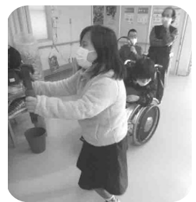
しっかり引っ張って～

望する方は、太ももにコントローラーを装着し、その場で足を上げて走る動作や、スクワットなどの動作を行います。みんな汗をかいて楽しく身体を動かされています。