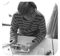
やっぱり肉は いいねえ～♪