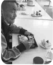
肉は美味しい♪ ケーキも美味しい♪

誕生会の弁当は、誕生会に参加される利用者の方に好きなものを選んでいただきました。「やっぱりお肉がいいなあ。」とお肉を希望される方が多かったため、ステーキやハンバーグの弁当を用意させていただきました。