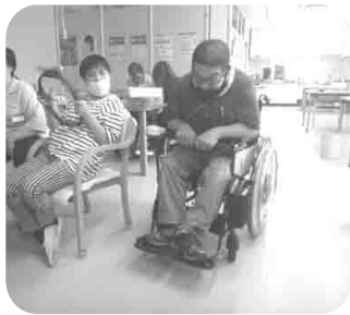
押して、押して お腹で押して～！

交代でゲームに参加していただき、上半身の運動を希望する方は、リング状の器具を両手で力いっぱい引っ張って広げる動作、縮めて抑え込む動作を行います。下半身の運動を希