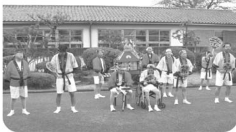
本番前、最後の練習！ さあ、優勝に向けてガンバルぞ！

ました。みんなで大声を出して額に汗をかきながらの出演で、惜しくも優勝には一步届きませんでした。が、「アイデア賞」を頂きました。今年度の合同文化事業のテーマは、「仲良く、楽しく、ともに自立を！」でありました。みんなで一緒に参加することをおして、日々の生活の中での絆づくりにつながったと思います。