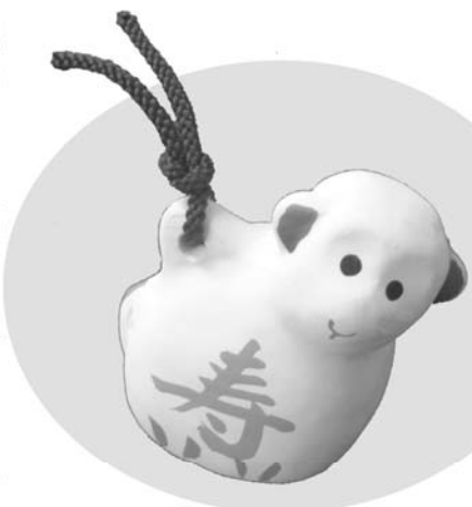
賀光寮陶芸科で作製した今年の干支『申』の土鈴です。