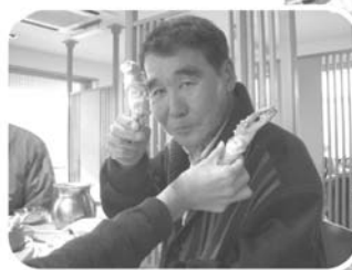
見てみい、この太い脚 美味いぞ～

午前10時スタートした参加施設毎の演目パフォーミング・アーツは、歌あり踊りあり、楽器演奏やコーラス、ダンスに劇、それから影絵などあつて大変ユニークな発