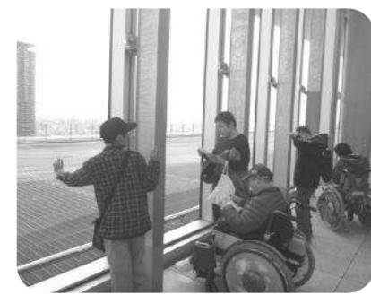
めっちゃ 高いやん!