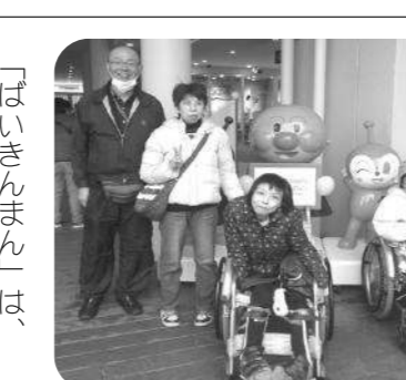
「ばいきんまん」は、 どこに隠れた??

事故があり、交通事情が悪かったため到着時間が遅れ、少し慌ただしくなりましたが、帰りには笑顔で「楽しかったよ」と言っていただけの日帰り旅行となりまし