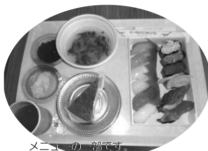
メニューの一部です。 美味しそうなネタがたくさん！